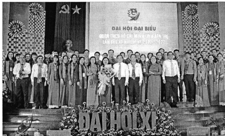
Đại diện Ban Bí thư Trung ương Đoàn, Lãnh đạo tỉnh tặng hoa chúc mừng BCH Tỉnh đoàn khóa XI, nhiệm kỳ 2022 – 2027.

Tiếp tục làm tốt công tác xây dựng Đảng và hệ thống chính trị; nâng cao vai trò lãnh đạo toàn diện, xuyên suốt của Đảng; nâng cao hiệu lực, hiệu quả của hệ thống chính trị. Toàn tỉnh kết nạp 1.101/900 đảng viên mới, vượt chỉ tiêu (122,33%); có 157/95 chi bộ ấp, khu phố được công nhận trong sạch, vững mạnh toàn diện vượt chỉ tiêu (165%); Ban chỉ đạo phòng chống tham nhũng, tiêu cực của tỉnh được thành lập, đi vào hoạt động; Tỉnh ủy đã lãnh đạo, chỉ đạo tổ chức thành công Đại hội các cấp, Đại hội đại biểu cấp tỉnh của Đoàn TNCS Hồ Chí Minh; Hội Cựu chiến binh; Hội Cựu TNXP tỉnh Bến Tre.