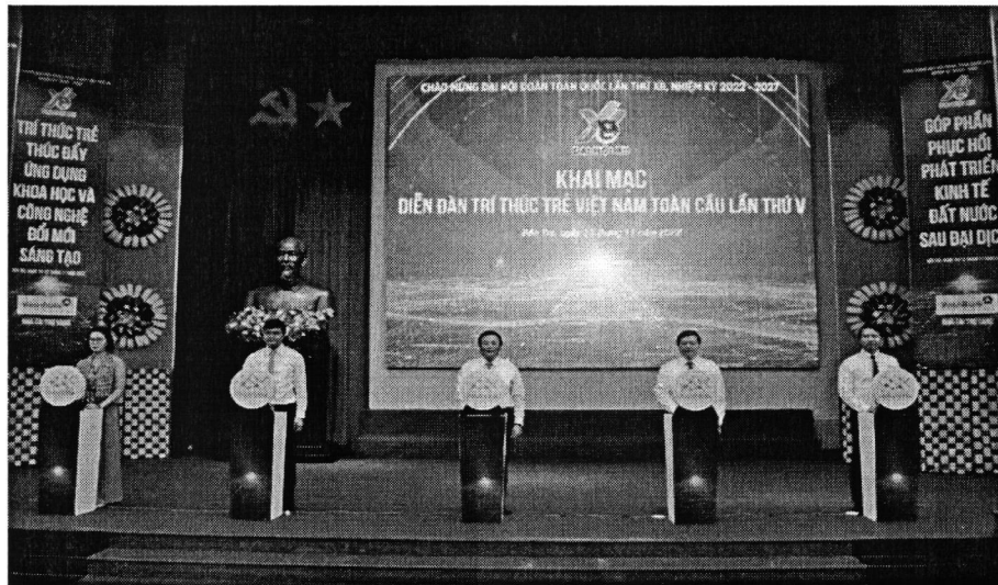
Ủy viên Bộ Chính trị Giám đốc Học viện chính trị Quốc gia Hồ Chí Minh Nguyễn Xuân Thắng (giữa), Bí thư thứ nhất TW Đoàn Bùi Quang Huy (thứ 2 từ trái sang) và UVBCH TW Đảng Bí thư Tỉnh ủy Bến Tre Lê Đức Thọ (thứ 2 từ phải sang) ấn nút khai mạc Diễn đàn Trí thức trẻ Việt Nam toàn cầu lần thứ V năm 2022.

Trong 2 ngày (11, 12/11/2022), Diễn đàn Trí thức trẻ Việt Nam toàn cầu lần thứ V năm 2022 với chủ đề “Trí thức trẻ thúc đẩy ứng dụng khoa học và công