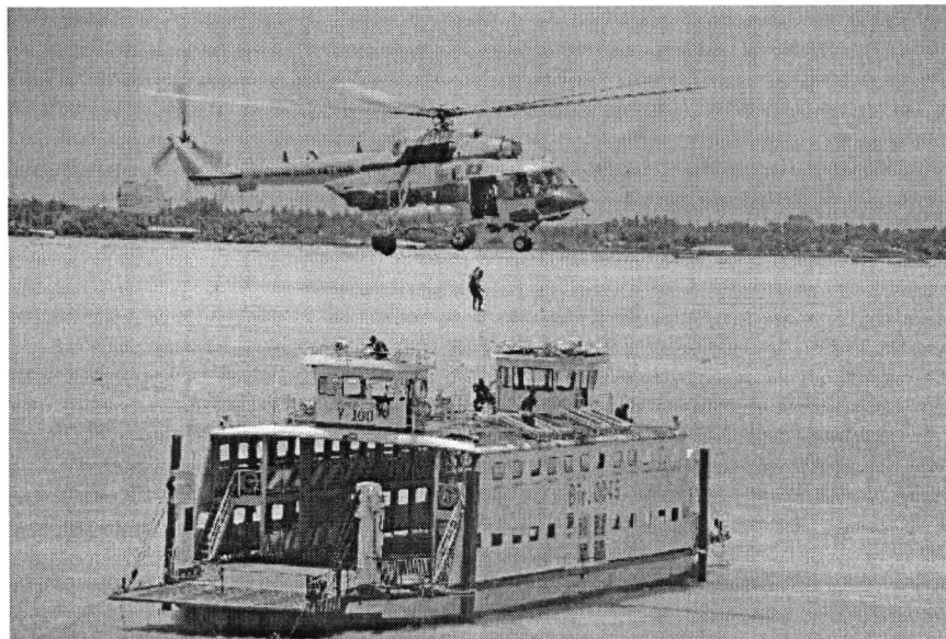
Tình huống giả định lực lượng đặc nhiệm, kết hợp với trực thăng tiêu diệt bọn khủng bố trên tàu.

Trong 2 ngày, 28, 29/7/2022, Ban Chỉ đạo Diễn tập tỉnh Bến Tre đã tổ chức thành công Diễn tập khu vực phòng thủ tỉnh Bến Tre năm 2022. Đây là cuộc diễn tập vận hành cơ chế lãnh đạo, có thực binh nhiều nội dung, mang tính tổng hợp cao