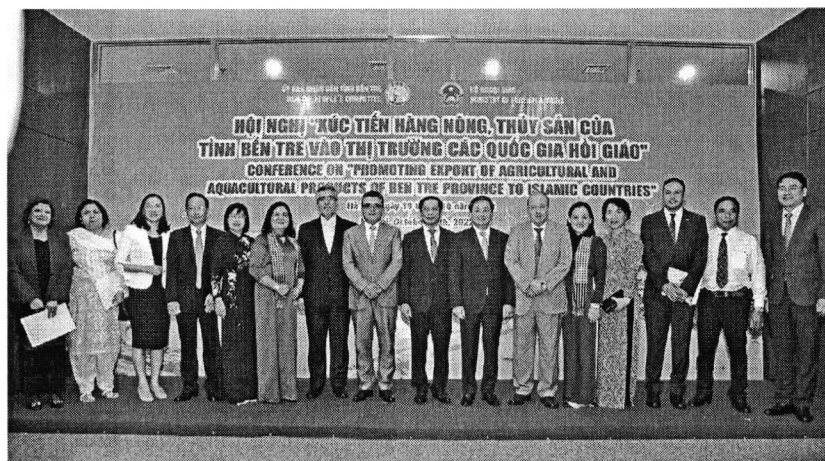
Lãnh đạo tỉnh Bến Tre và các ngành, doanh nghiệp xúc tiến thương mại mở rộng thị trường các quốc gia Hồi giáo.