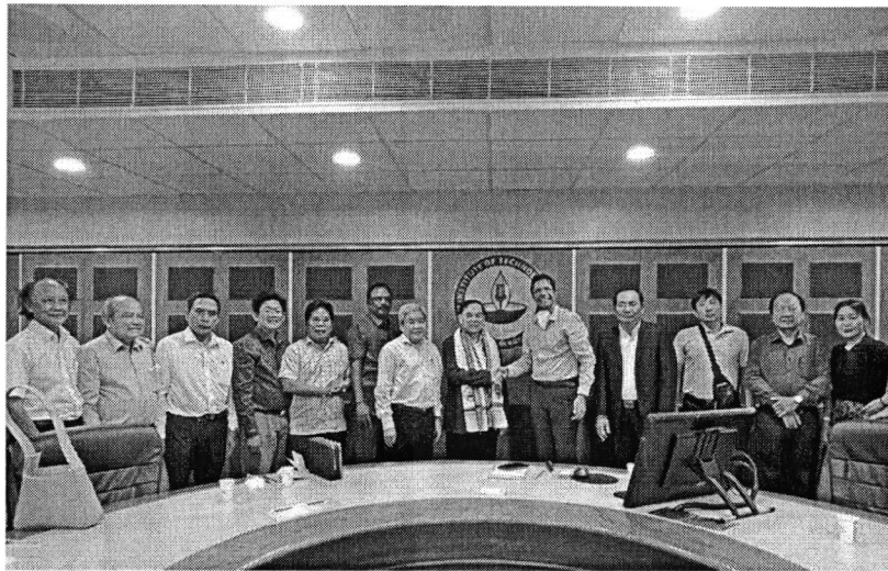
Đoàn công tác tỉnh Bến Tre do Chủ tịch UBND tỉnh làm trưởng đoàn làm việc với Viện Nghiên cứu công nghệ Madras (Ấn Độ).

Trong năm 2022, Tỉnh đã tiếp và làm việc với 255 đoàn nhà đầu tư trong và ngoài nước, trong đó có 25 đoàn nhà đầu tư nước ngoài như Hàn Quốc, Nhật Bản, Philippines, Ý, Hungary, Thổ Nhĩ Kỳ, Áo, Anh, Ấn Độ, Phần Lan... đến tìm hiểu môi trường đầu tư, kinh doanh tại tỉnh. Đồng thời, tổ chức các Chương trình “Kết nối giao thương - Tăng trưởng xuất khẩu” sang thị trường Lào và Thái Lan; tham gia chương trình Giao thương xúc tiến thương mại tại thị trường Pháp, Hà Lan, Hàn Quốc, CH Sec, Mỹ; kết nối đoàn giao thương với Thụy Điển, Na Uy, Italy, Đức, Đoàn công tác Ai Cập, Hội chợ SIAL tại Pháp; tổ chức Hội nghị “Xúc tiến hàng nông, thủy sản của tỉnh Bến Tre vào thị trường các quốc gia Hồi giáo; tiếp và làm việc với Đoàn công tác của Đặc phái viên của Tổng thống Hoa Kỳ John Kerry thăm và làm việc với Bến Tre về tình hình biến đổi khí hậu; ký kết Bản ghi nhớ