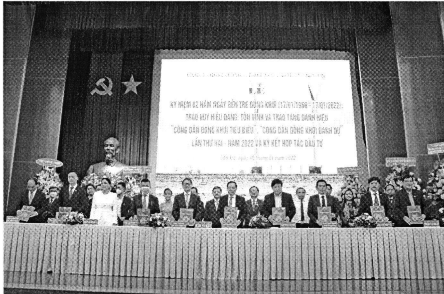
Chủ tịch UBND tỉnh Trần Ngọc Tam ký kết hợp tác với 10 đối tác chiến lược nhân kỷ niệm 62 năm ngày Bến Tre Đồng khởi.

những năm tiếp theo trên các lĩnh vực: năng lượng, công nghiệp, bất động sản, nông nghiệp, hạ tầng giao thông, đô thị, du lịch sinh thái, các dự án hạ tầng kỹ thuật, phát triển kinh tế biển, mở rộng không gian phát triển và các lĩnh vực tài chính, ngân hàng, thương mại, dịch vụ, chuyển đổi số,... với quyết tâm phấn đấu đưa tỉnh phát triển khá thuộc nhóm V khu vực ĐBSCL vào năm 2025 và nhóm 30 của cả nước vào năm 2030.