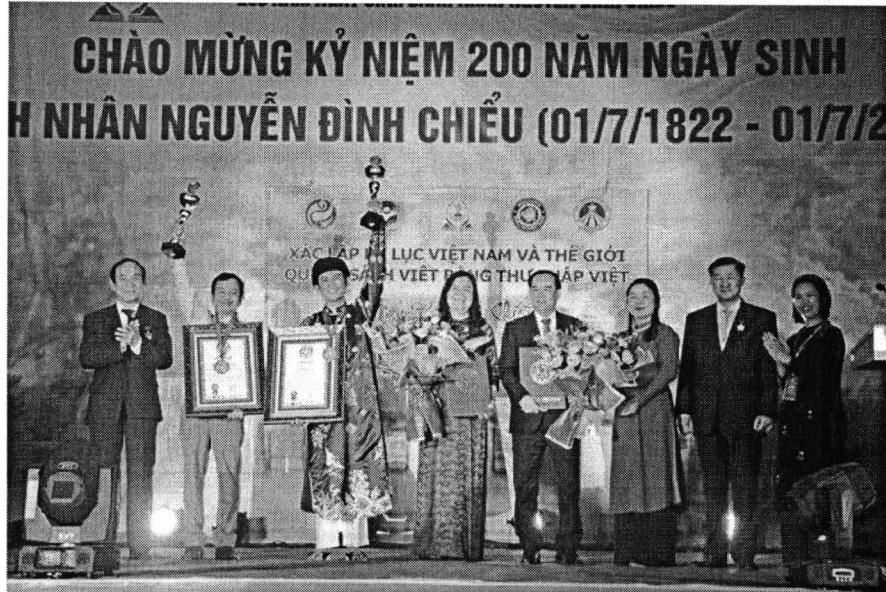
Công bố và trao xác lập kỷ lục Thế giới đối với quyển sách thư pháp “Nguyễn Đình Chiểu thi tuyển”.

quyển sách nhằm tôn vinh và ghi nhận về cuộc đời, sự nghiệp của Nguyễn Đình Chiểu; đồng thời, giáo dục lòng yêu quê hương đất nước, nâng cao nhận thức trong việc giữ gìn và phát huy bản sắc văn hóa dân tộc cho thế hệ hôm nay và mai sau.