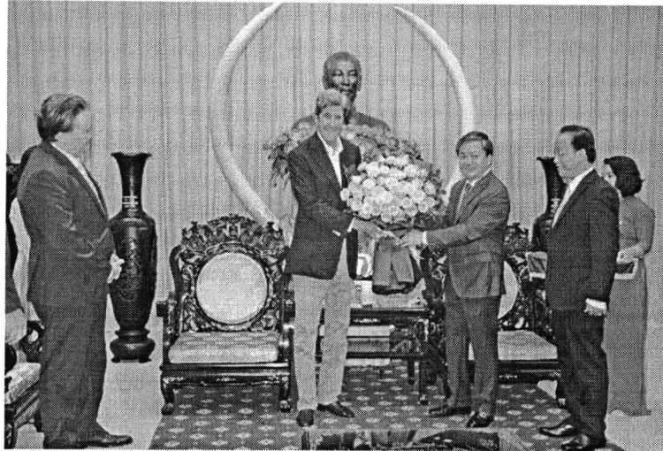
Lãnh đạo tỉnh tiếp và làm việc với Ngài John Kerry - Đặc phái viên của Tổng thống Hoa Kỳ thăm và làm việc với Bến Tre.