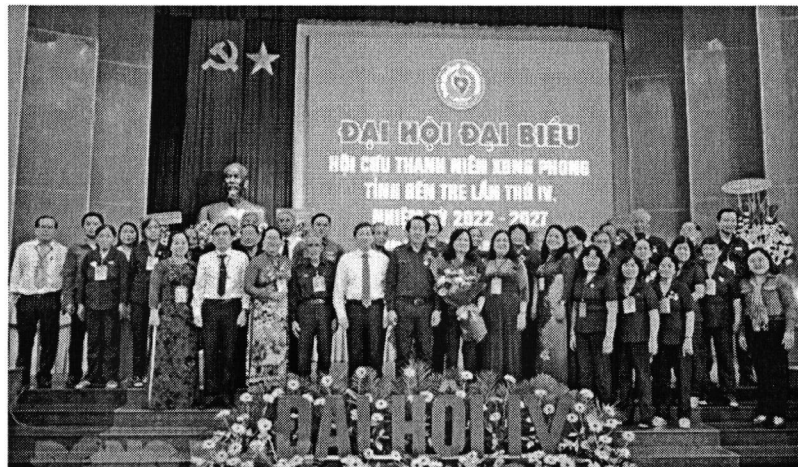
Đại diện Lãnh đạo Hội Cựu TNXP Trung ương, đại diện lãnh đạo tỉnh Bến Tre chúc mừng Ban Chấp hành mới ra mắt tại Đại hội.