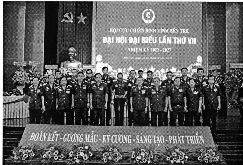
BCH Hội Cựu Chiến binh tỉnh Bến Tre khóa VII, nhiệm kỳ 2022 – 2027 ra mắt tại Đại hội.